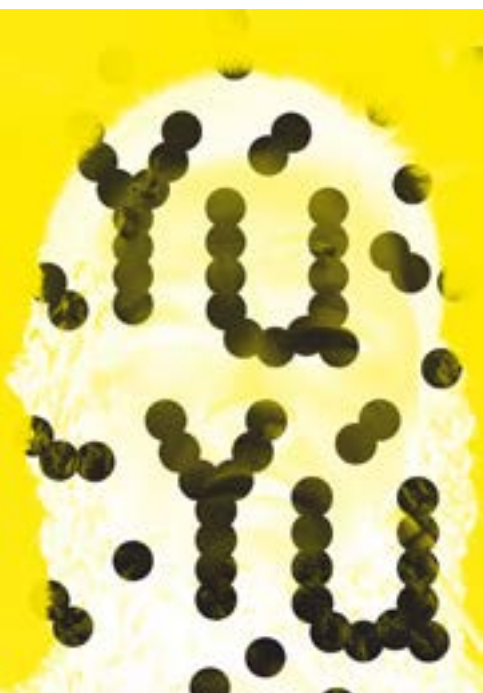
© YúYú film - Marc Johnson