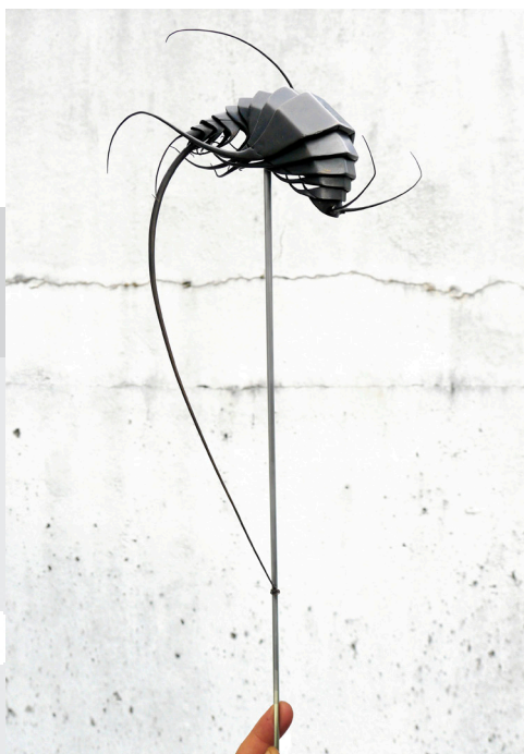
Des petits dieux de misère #1 - Kyoto - Montreuil 2015

Mylinh Nguyen est lauréate du prix pour l'intelligence de la main - Talents d'exception de la fondation Bettencourt-Schueller - 2013.