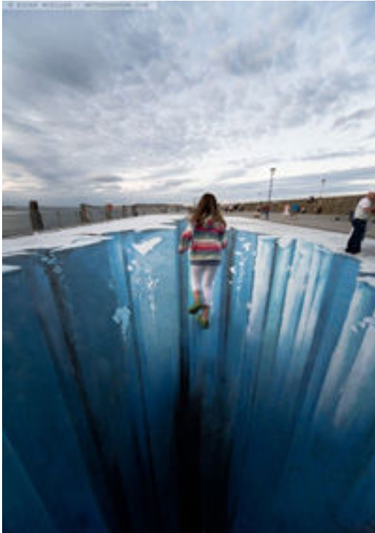
Edgar Mueller, The Crevasse , 2008

De cette façon, l'installation d'Hanna Maria crée des jeux de transparence et de lumière grâce au cellophane transparent, suscitant des visions propres à chaque spectateur et de nouvelles perceptions jouant sur les effets d'optique . Ces effets d'optique sont des erreurs de perception de la réalité donc de forme, de couleur, de dimension ou de mouvement !