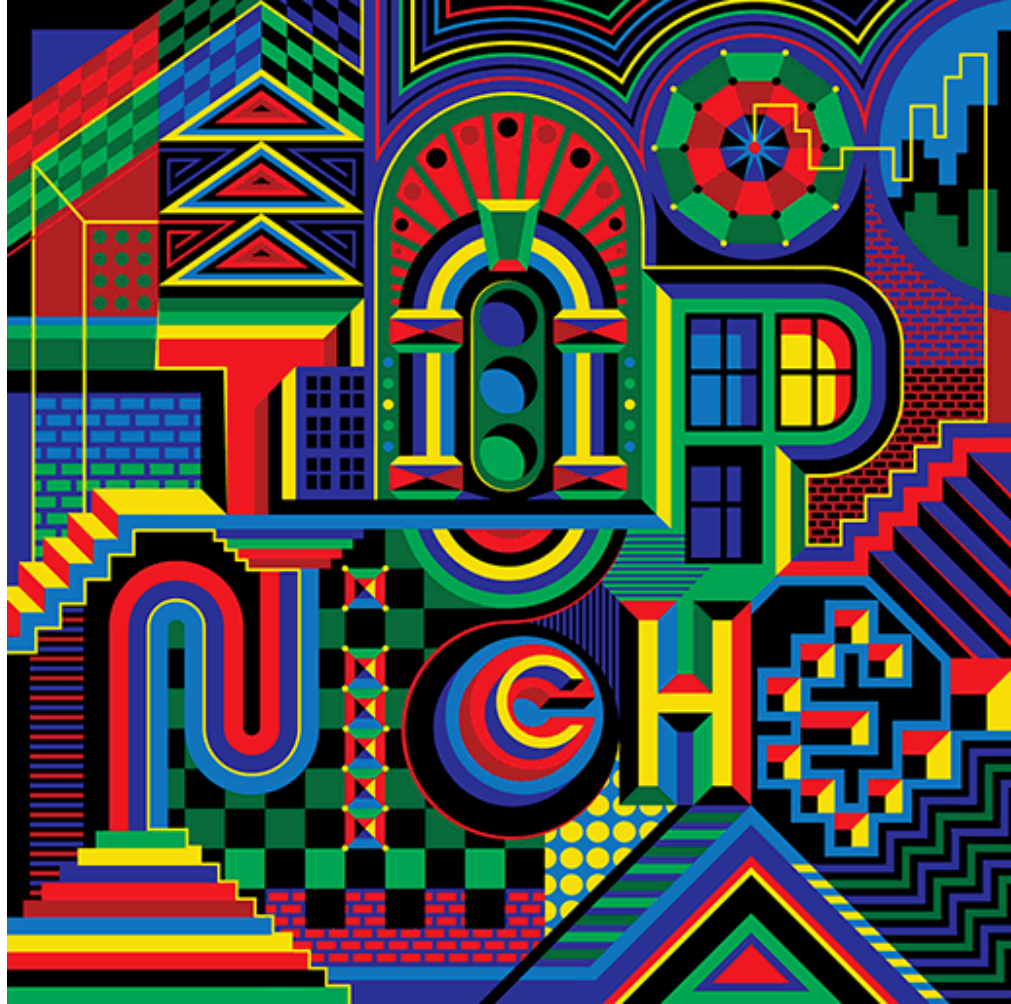
Matt W. Moore, poster series of custom typography explorations, 2017