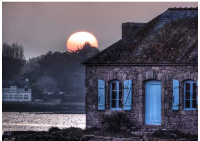
Îlot de Nichtarguer, Saint-Cado, Morbihan, Céline LT